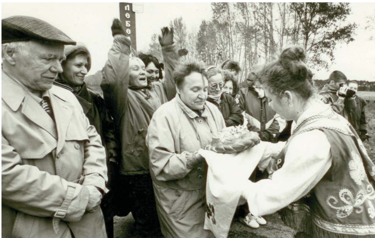
Замятинские чтения 1997 г.: встреча участников в Лебедяни