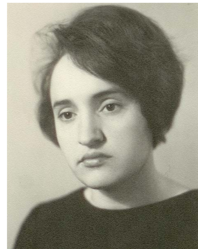
Выпускница МГУ им. М.В. Ломоносова, 1967