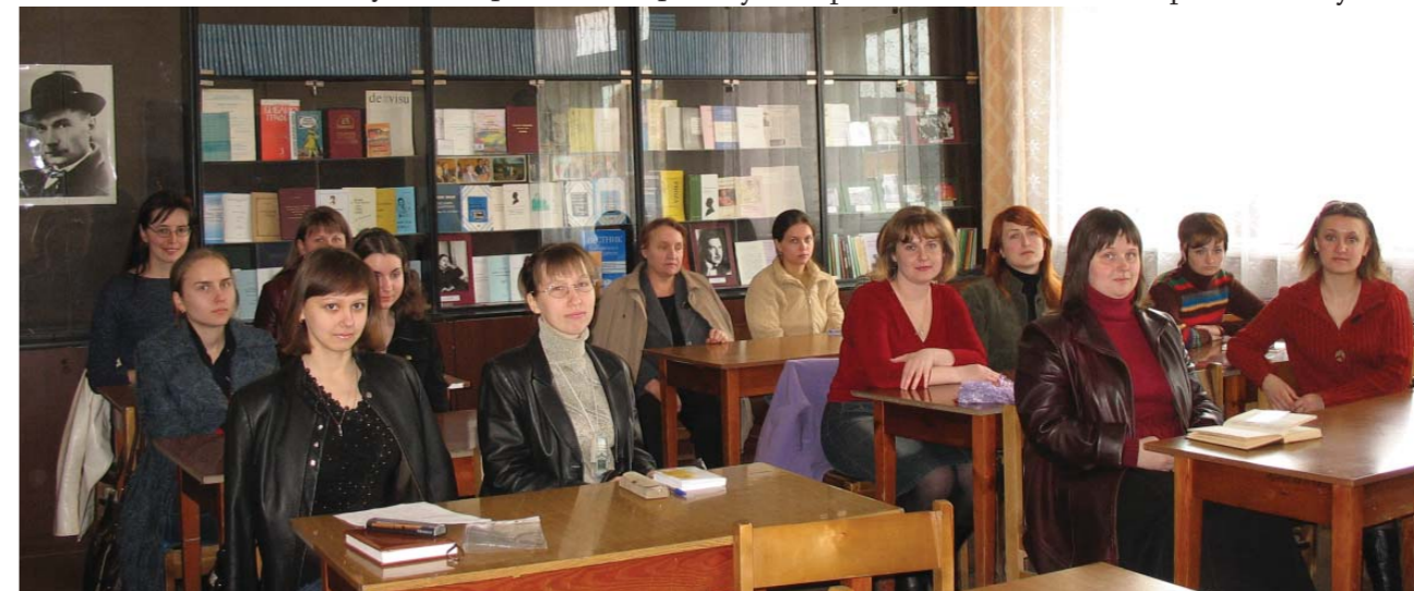
Занятие научного семинара в Замятинском центре