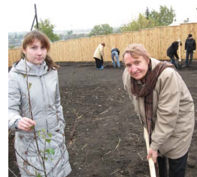
Закладка яблоневого сада в замятинской Лебедяни, 2009 г.

Помимо пленарных и секционных заседаний, были проведены два круглых стола: «Современное состояние преподавания литературы в вузе и школе» и «К выходу нового российского научного журнала "Филологическая регионалистика"» (издание Тамбовского университета). Участники и гости конгресса посмотрели презентацию книжного, документального и диссертационного фонда Международного Замятинского центра в Тамбове, насчитывающего несколько сотен уникальных единиц хранения. Самые яркие