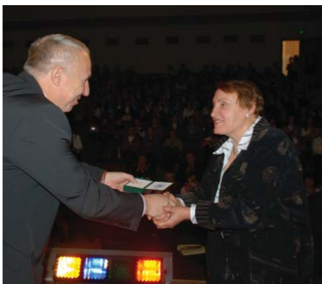
При вручении награды, 2010 г.

Осуществлено издание полного цикла учебно-методических пособий и программ «История русской литературы. 1-5 курсы» в 13 книгах, разработанного коллективом кафедры истории русской литературы и полностью обеспечивающего учебный процесс по изучению русской литературы. Некоторые книги получили гриф НМС УМО университетов РФ.