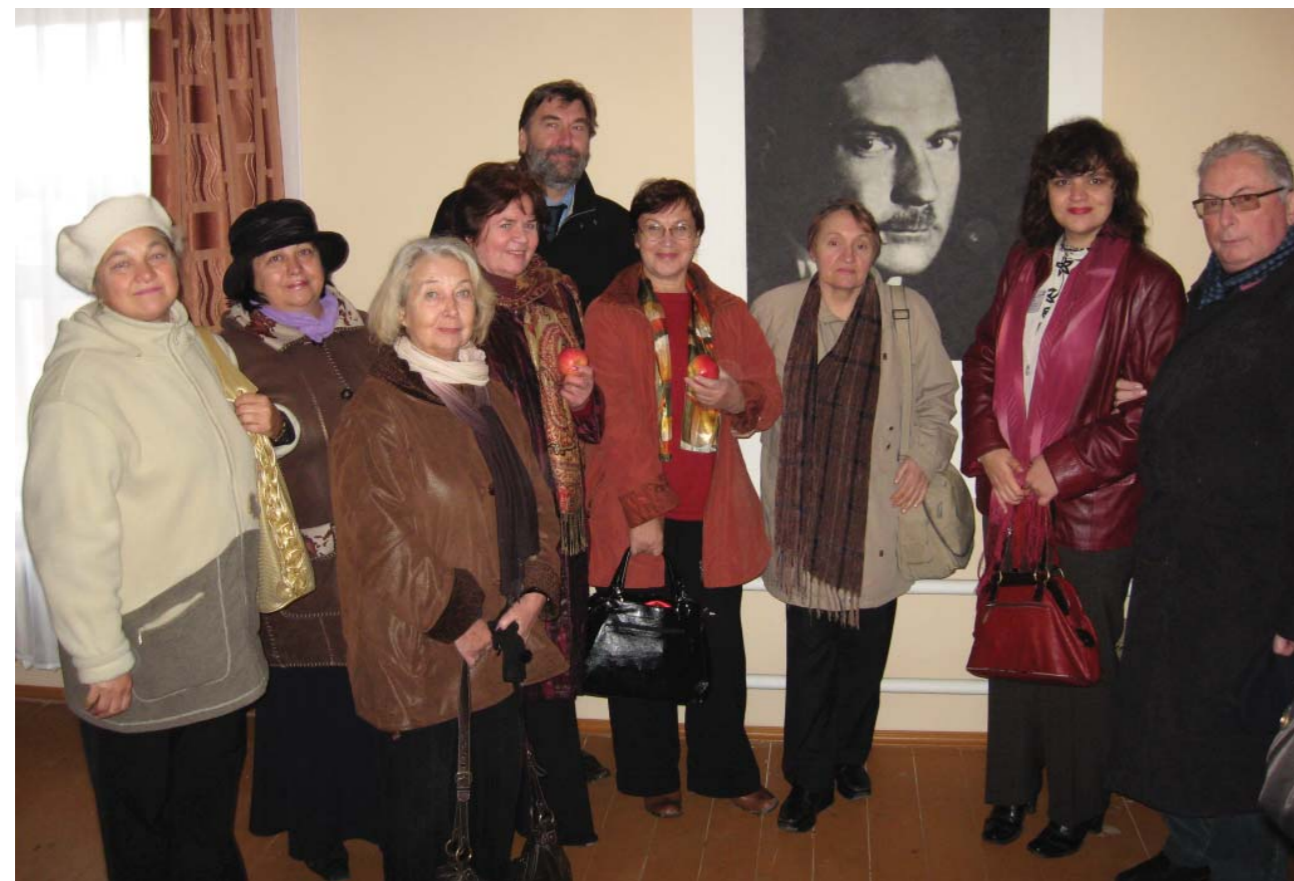
Открытие восстановленного Дома Е.И. Замятина в Лебедяни 9 октября 2009 г.

5–8 октября 2009 года состоялся Международный конгресс литературоведов, приуроченный к 125-летию Е.И. Замятина. Организаторами этого масштабного научного форума выступили Международный научный центр изучения творческого наследия Е.И. Замятина в Тамбове, его отечественные (Елец, Мичуринск) и зарубежные (Краков, Лозанна) филиалы, Институт мировой литературы имени А.М. Горького РАН. В программе конгресса заявлено более 130 докладов и научных сообщений российских и зарубежных исследователей. В работе форума приняли участие член-корреспондент РАН Н.В. Корниенко (Москва), проф. В.В. Агеносов (Москва), проф. Т.Д. Белова (Саратов), проф. Х. Вашкелевич (Польша), проф. Л.М. Геллер (Швейцария), проф. М.М. Голубков (Москва), проф. Гольдт (Германия), проф. Г.З. Горбунова (Казахстан), проф. К.Д. Гордович (Санкт-Петербург), проф. Гурленова Л.В. (Сыктывкар), проф. Т.Т. Давыдова (Москва), к.ф.н. А.А. Житенев (Воронеж), к.ф.н.