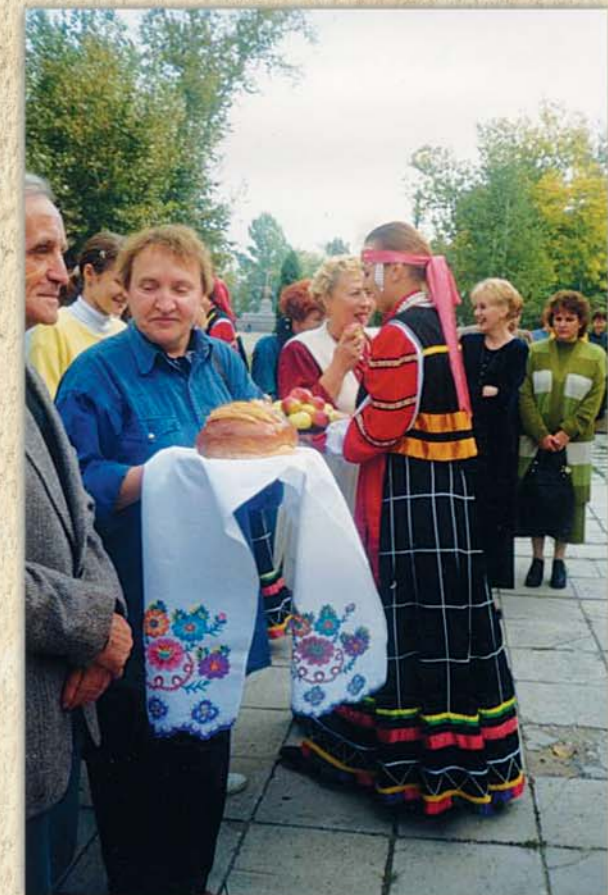
Замятинский город Лебедянь встречает участников тамбовских Замятинских чтений, 2002 г.