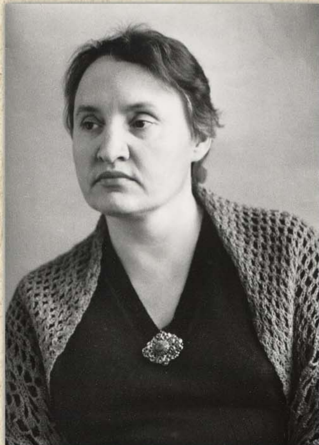
Замятинские чтения, 1997 г.