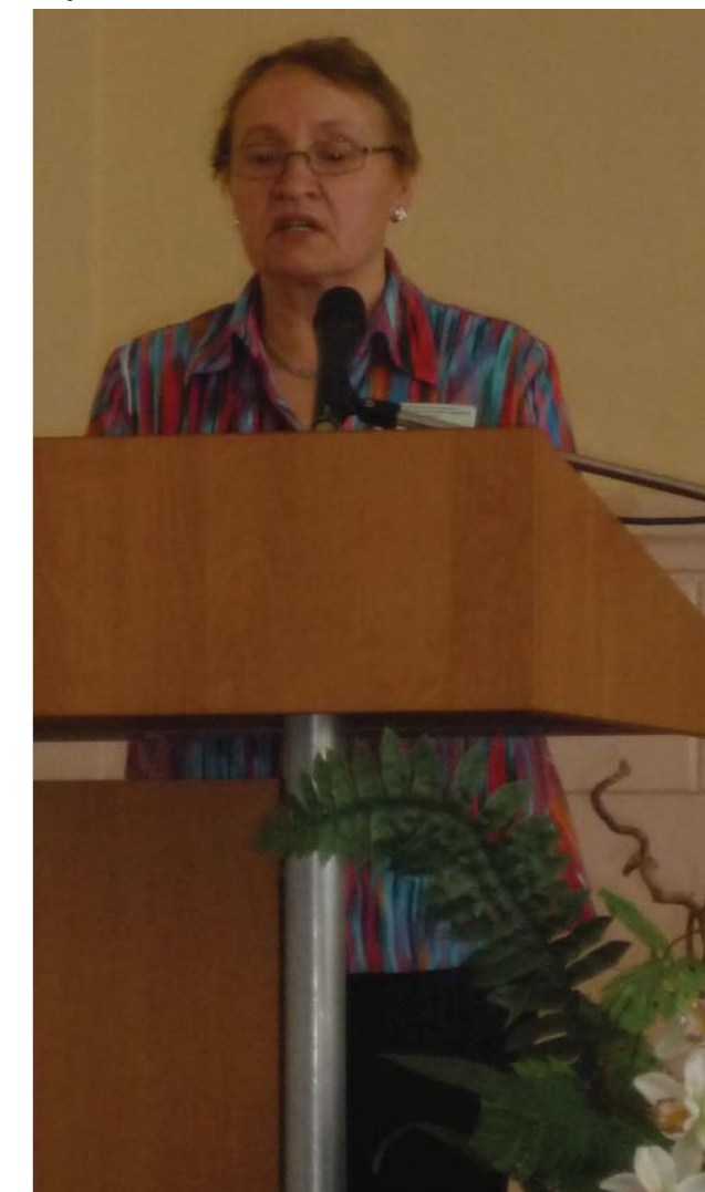
Научный доклад на Днях славянской письменности, 2006 г.

Опубликованы многочисленные работы студентов.