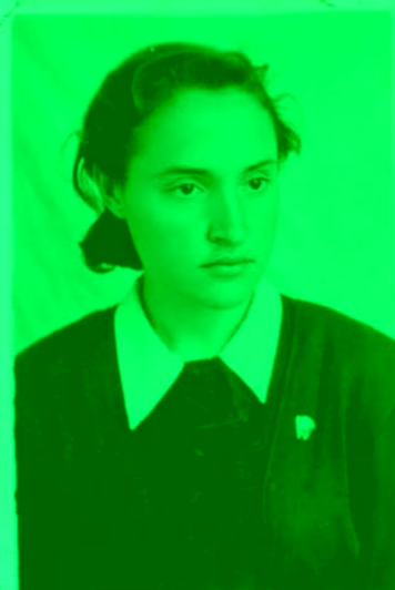
10 класс, Староюрьевская средняя школа. 1960 г.