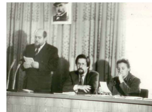
Первые Замятинские чтения, 1994 г.