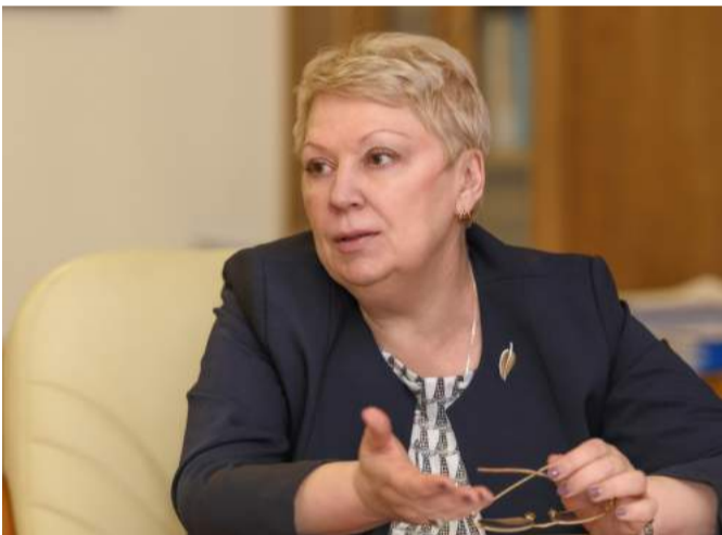
Министр образования и науки РФ Ольга Васильева:

«Я убежден, что отсутствие бюджетных мест или малое количество не должно препятствовать поступлению талантливой молодежи в вуз. В феврале этого года мы учредили гранты на обучение в Державинском университете по направлениям подготовки в сфере культуры и искусств, физической культуры. В дальнейшем мы планируем продолжать практику таких конкурсов, чтобы талантливые дети оставались в регионе».