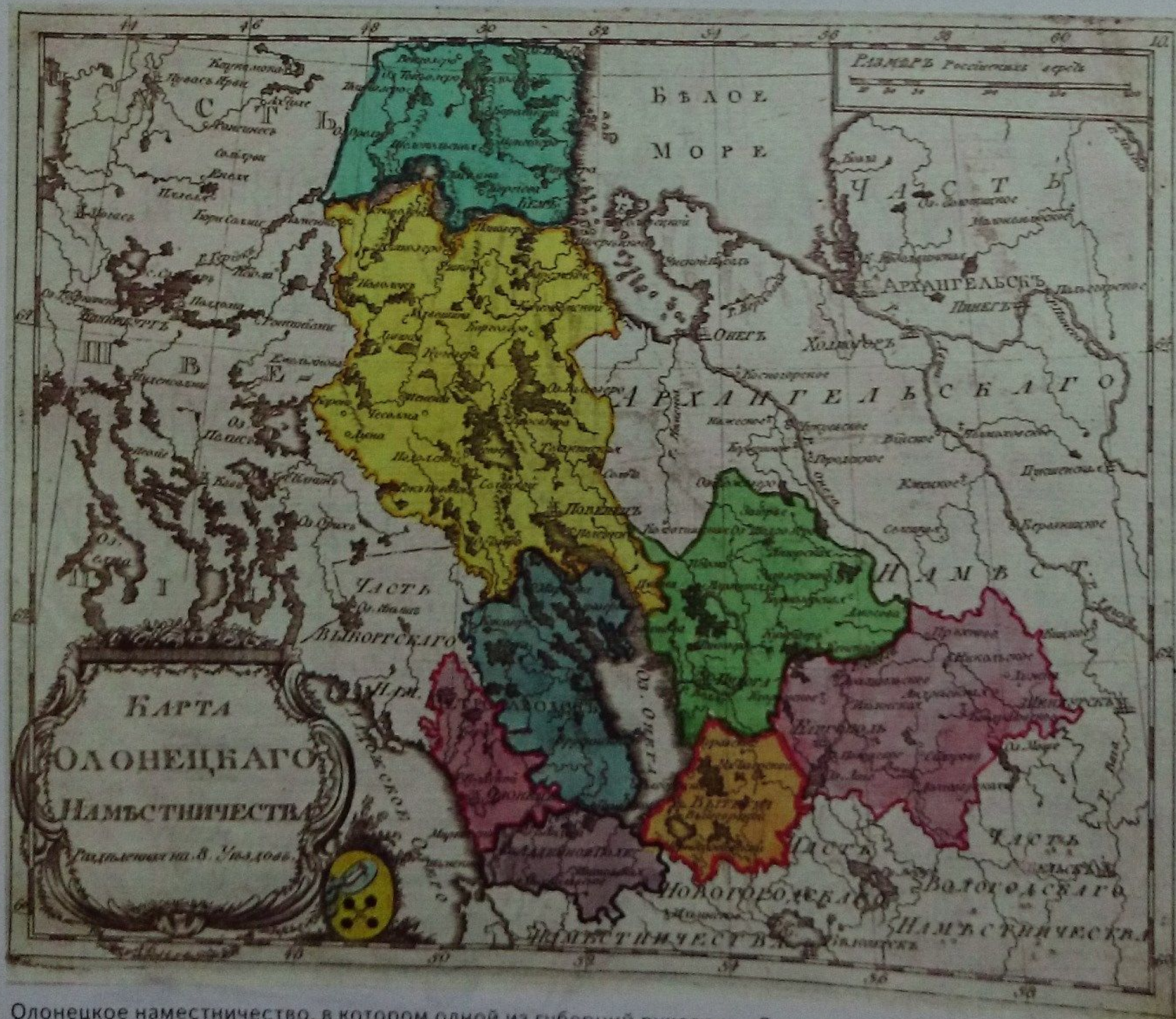
Олонецкое наместничество, в котором одной из губерний руководил Гавриил Державин, в XVIII веке было самым крупным на северо-западе России.

Генерал-губернатору в этой управленческой конструкции отводилась роль стратега-куратора: он не занимался рутинной, а обеспечивал «правильную линию» развития региона. На губернатора же возлагались тактические задачи управления вверенной территорией. И все было бы хорошо, если бы не частые конфликты между генерал-губернаторами и губернаторами на почве споров о разграничении властных полномочий. А происходили они из-за размытой формулировки закона, в тексте которого не было конкретных инструкций, как следовало действовать двум высшим чиновникам на местах в случаях спора и административных коллизий. Это вносило особый колорит в систему местного администрирования, порождало ка-